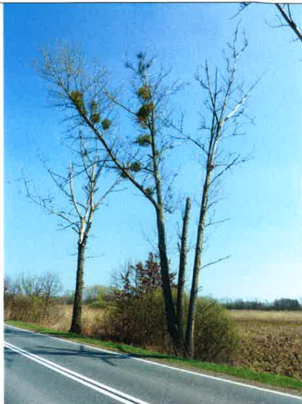
2, 3, 4