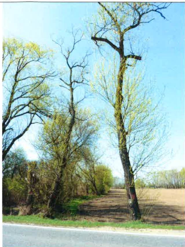
18, 19, 20