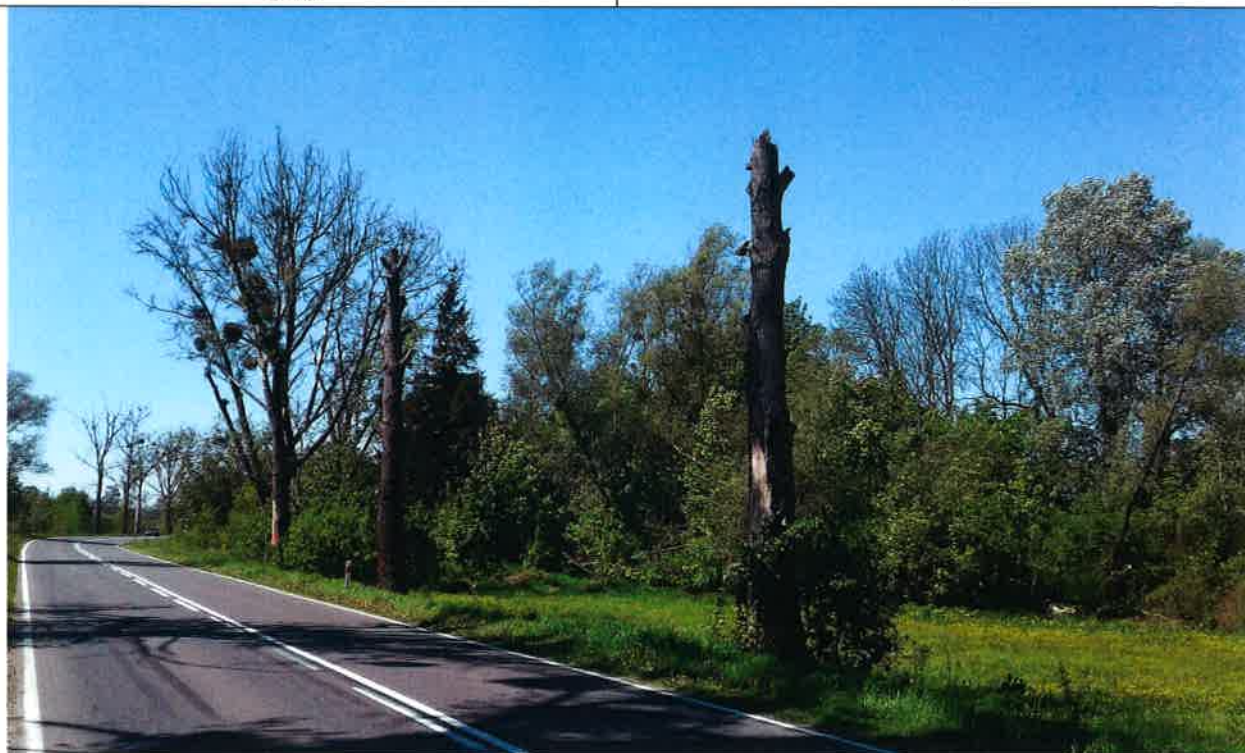
31, 32 33